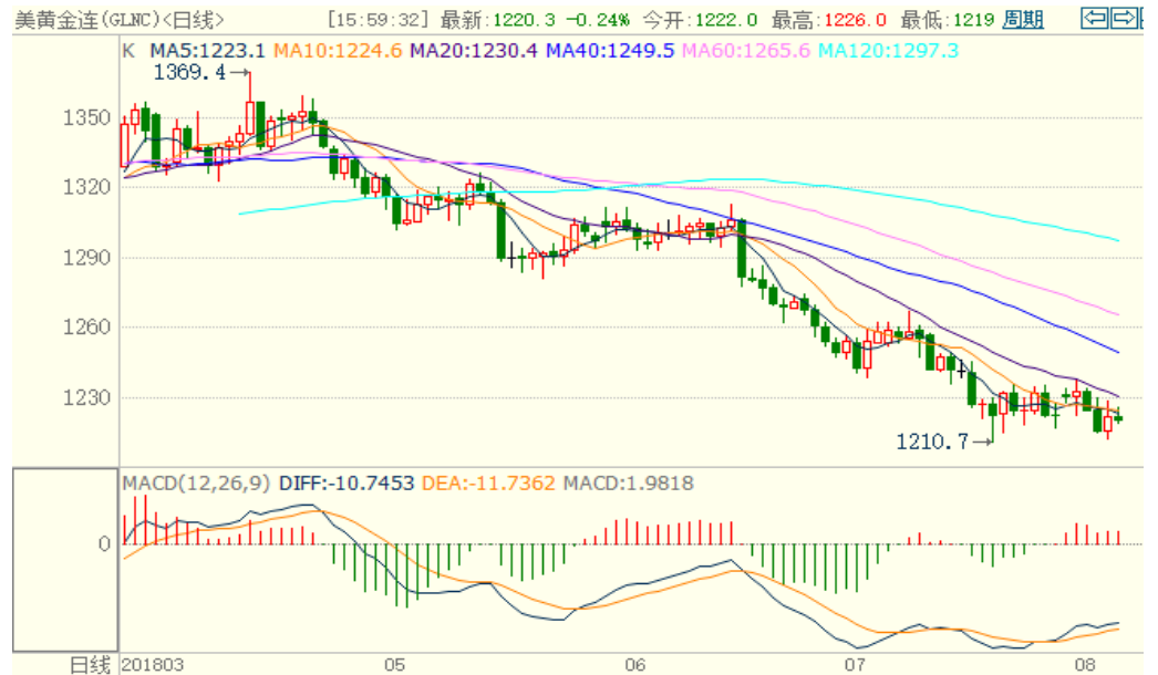
图 1：COMEX 黄金主力合约技术分析

COMEX 黄金上周震荡下跌，技术指标偏中性，预计本周大概率维持震荡。由于加息预期、美国经济强劲等，金银中线仍偏空。