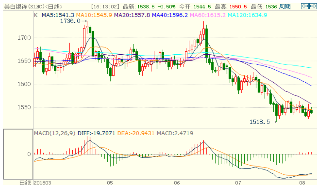
图 2：COMEX 白银主力合约技术分析